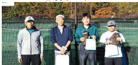
一般男子3～4位G優勝 準優勝