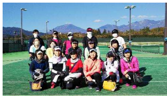
一般女子選手一同