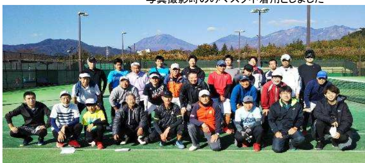
一般男子選手一同