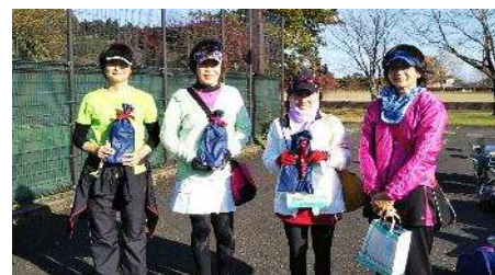
一般女子3～4位G 優勝 準優勝