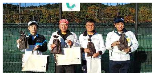
60歳以上男子 優勝 準優勝