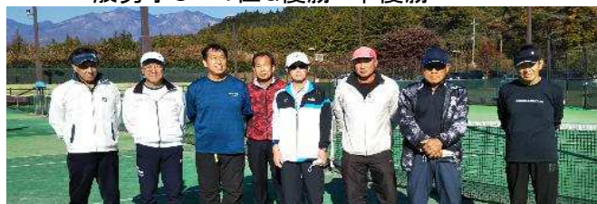
60歳以上男子選手一同