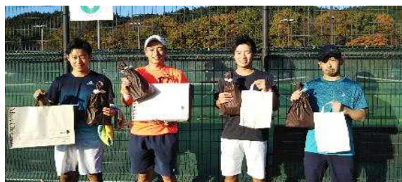
一般男子 優勝 準優勝