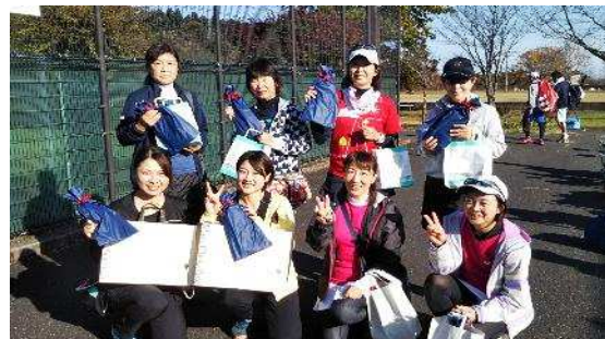
一般女子 優勝 準優勝 3位