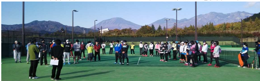
開会式はマスク着用

種目 一般男子ダブルス 一般女子ダブルス 60歳以上、ビギナーは参加者が少なく一般に組入れ 試合形式 全て 6ゲーム先取 セルフジャッジ制 ノーアドバンテージ方式 予選リーグ戦⇒ 各ブロック1位・2位による決勝トーナメント(抽選にてドロウ決定) その他 練習時間は初戦のみ3分、それ以降はサービス6本/人のみ アナウンスが聞こえる範囲にて待機のこと トイレは、野球場レフト守備位置付近 更衣室はコロナウイルス感染予防のため閉鎖 コンビニは日光方面3kmローソン、宇都宮方面2kmセブンイレブン 大会後記 紅葉の綺麗な秋晴れに恵まれ総勢40組80名のテニス好きが集まり楽しく厳しい 戦いが朝9時から午後5時15分まで行われた。 新型コロナウイルス感染予防を参加者全員が意識し、本年度の6回の大会を 無事終了することができたことはご同慶の至りです。ありがとうございました。 今大会は参加者が多くの試合ができるようにリーグ戦を組んだので試合数が多く 午後4時30分から5時15分までナイター照明を利用した。 来年度以降の大会はクラス分けやオープン数減などを検討して行きたい。