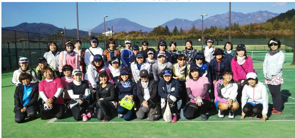
女子選手一同(写真撮影時はマスク無し)