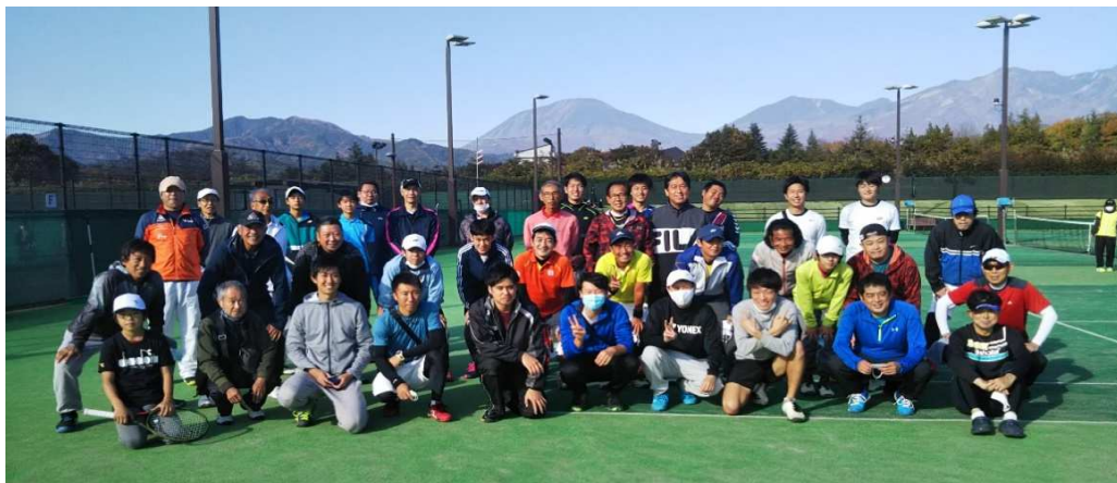
男子選手一同(写真撮影時はマスク無し)