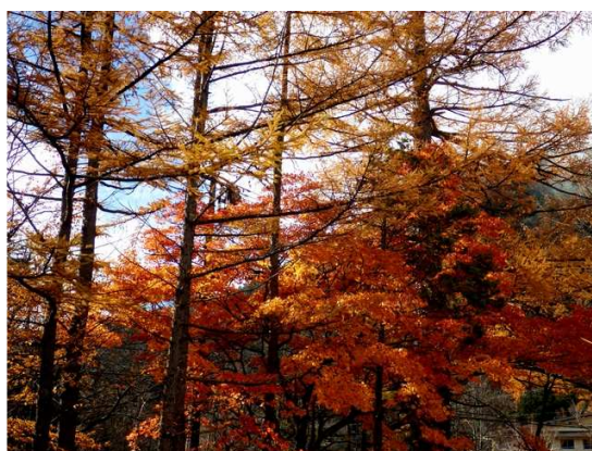
奥日光最後の紅葉