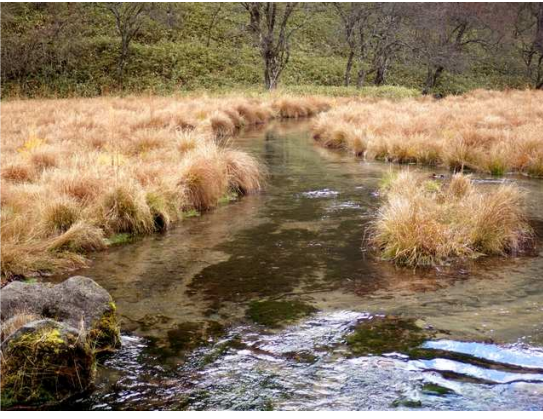
初冬の谷地坊主光徳にて