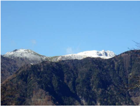
白根山・五色山・奥白根山