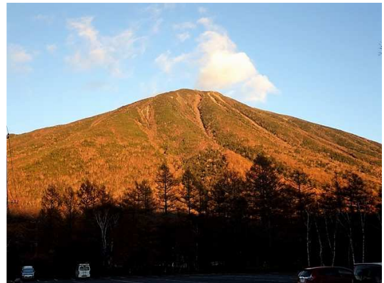
夕陽浴びる男体山