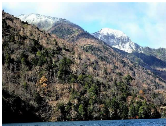
冠雪の五色山・金精山